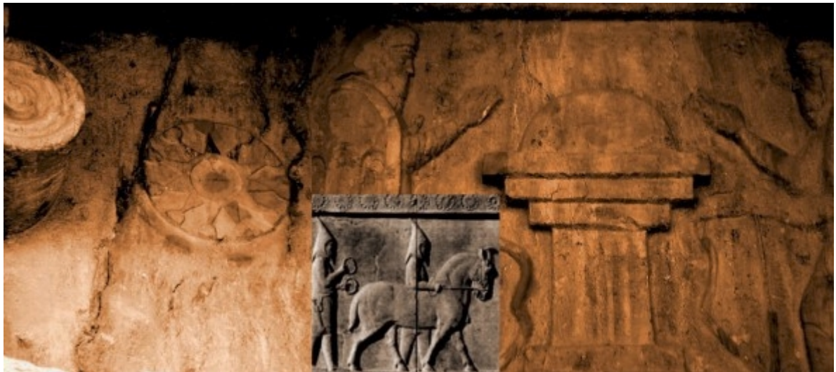
مقبره کیاکسار در کردستان – یک مغ ماد با حلقه مهر

پیش از به پایان بردن این جستار نیک است اگر نگاهی دوباره داشته باشیم به استفاده از نماد خورشید در اسطوره/ ایزدان ایرانی. به تصاویر زیر توجه کنید دایره نمادی از خورشید است و حلقه که نمادی از مهر که همزمان ایزد مهر و پیمان است در این تصاویر قابل مشاهده اند. آنچه ریشه ایرانی/آریایی این نماد که در دستان و یا در بالای سر فروهر، میترا، هورس و ویکا و مغان مادی دیده می شود را می تواند تایید کند قدمت این نماد نزد آریاییان است. نزدیک ترین احتمال دیگر به دلیل قدمت تمدنی مصریانند که ممکن است استفاده از این نماد نخست از سوی آنان صورت پذیرفته باشد و سپس سایر ملل از آنان اقتباس کرده باشند که به دلیل روشنی قابل رد است زیرا این نماد در قوم هیتی که آریایی نژاد بوده و توسط مصریان نابود شده اند نیز دیده شده است با تاریخی کهن تر از مصریان و همچنین این نماد بر مقبره کیاکسار (cyaxares) بنیان گزار پادشاهی ماد که در کردستان دفن است نیز موجود است که نشانگر وجود این نماد پیش از هخامنشیان در میان اقوام آریایی است .