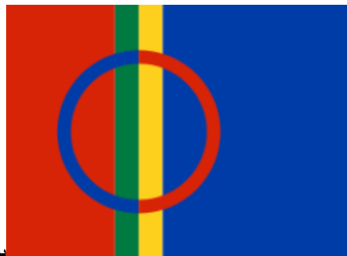
پرچم سامی های اسکاندیناوی

- گروهی از بومیان اسکاندیناوی نیز که آنها را سامی sami میخوانند و خود را فرزندان خورشید "parneh Paiven" می دانند و حتی پرچمشان که در زیر مشاهده می کنید خورشیدی را در مرکز خود نقش بسته است و از سوئد و فنلاند و نروژ تا غرب روسیه پراکنده اند نیز این روز با نام تولد الهه خورشید بی وه Beiwe جشن می گیرند..