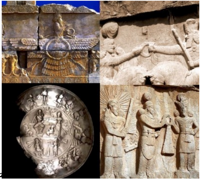
تصاویری متاخرتر در دوره های هخامنشی