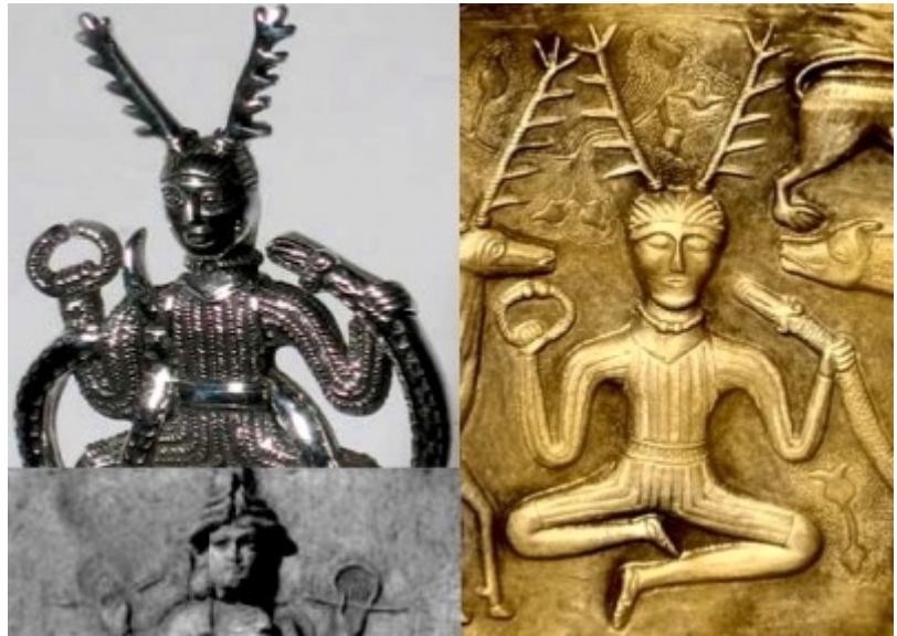
ویکا ایزد خورشید اقوام نوردیک و ژرمنها با حلقه مهر در دست