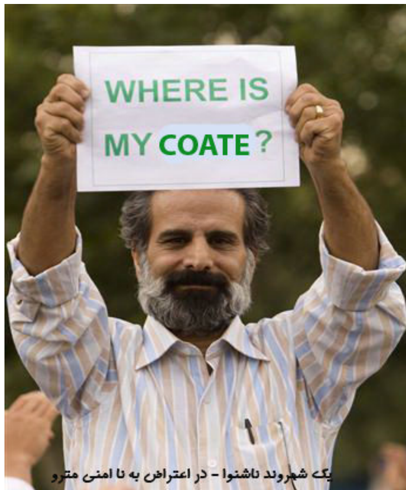
یکه شهروند ناشنوا - در اعتراض به نا امنی مترو