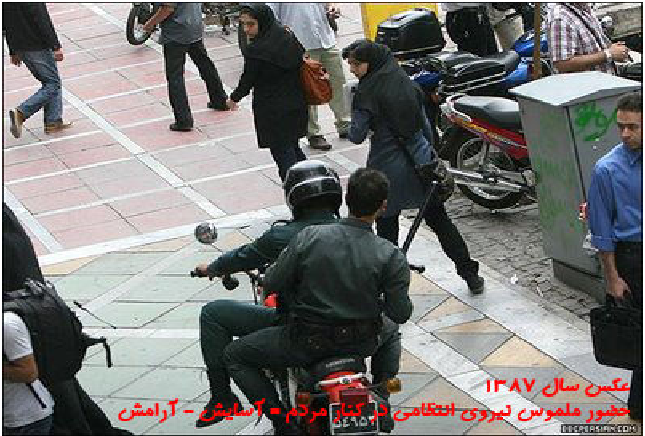
عکس سال ۱۳۸۷ حضور ملبوس نیروی انتظامی در کنار مردم = آسایش - آرامش