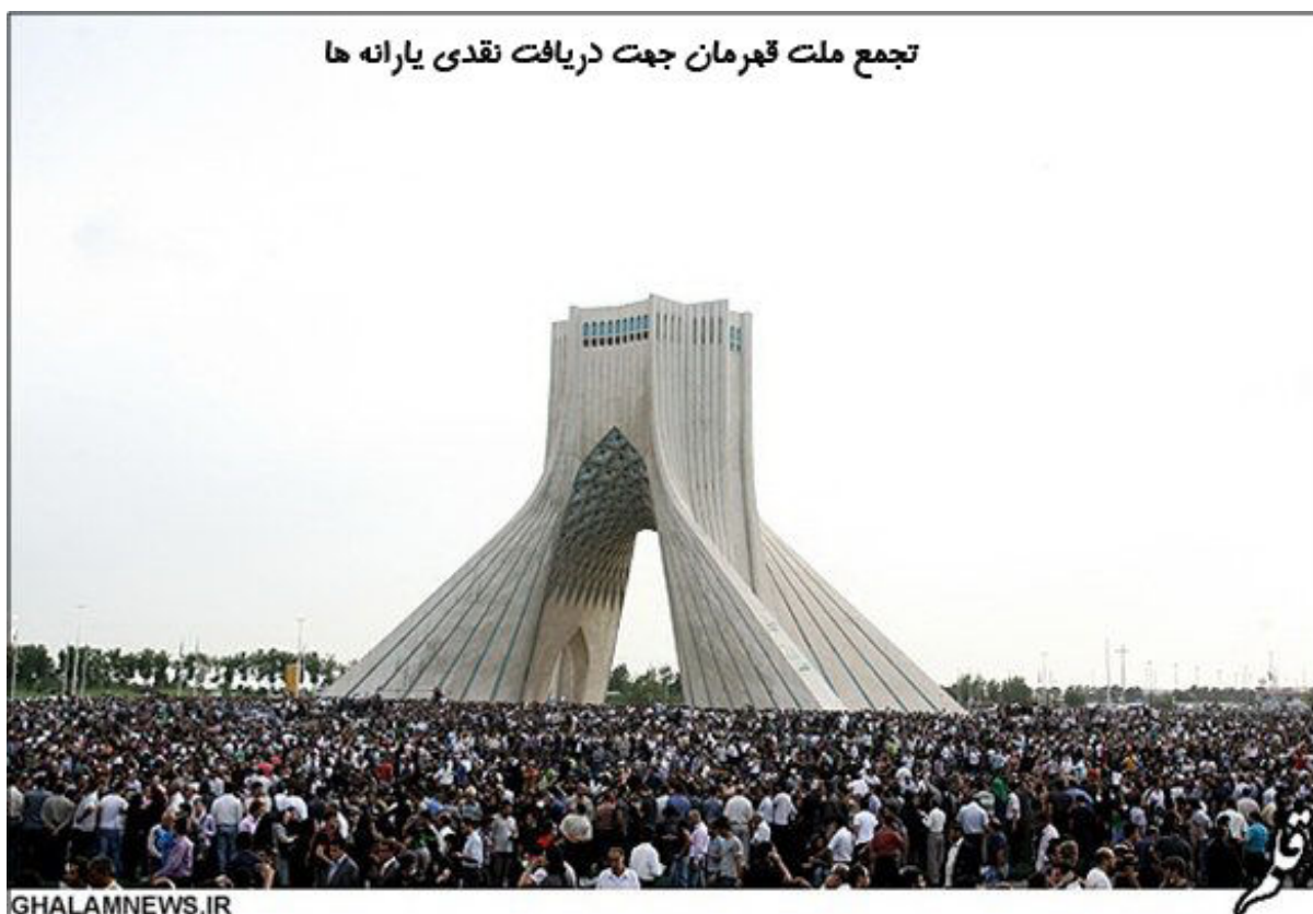
تجمع ملت قهرمان جهت دریافت نقدی یارانه ها