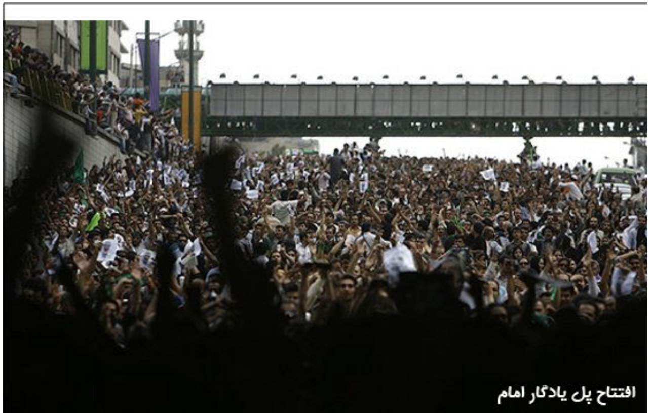
افتتاح پل یادگار امام