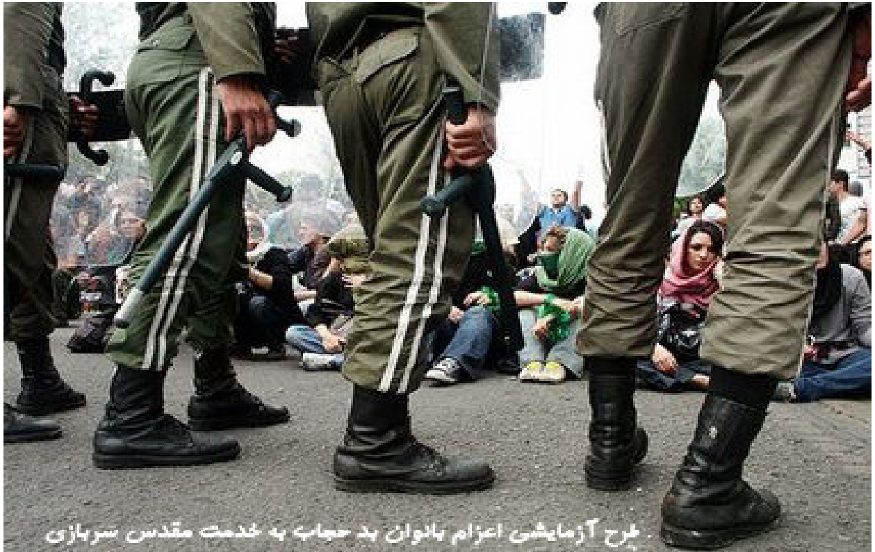
فرح آزمایشن اعزام بانوان بد حجاب به خدمت مقدس سربازی