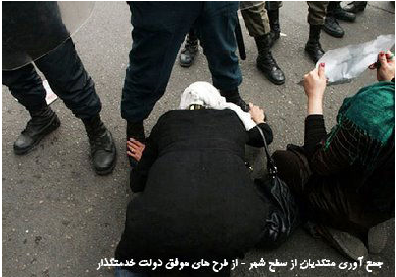
جمع آوری متکدییان از سطح شهر - از طرح های مولف دولت خدمتگذار