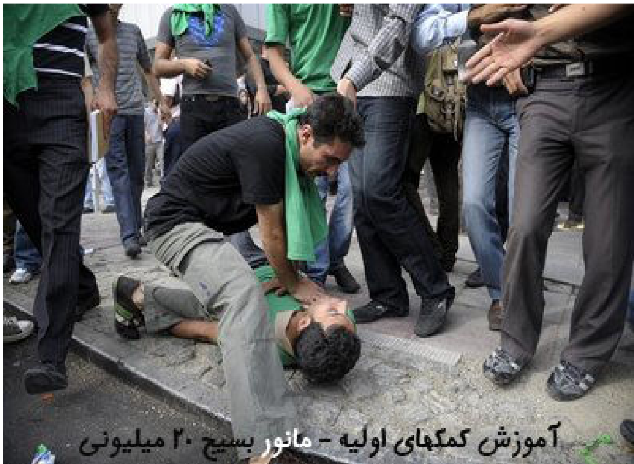
آموزش کمکهای اولیه - مانور بسیج ۲۰ میلیونی