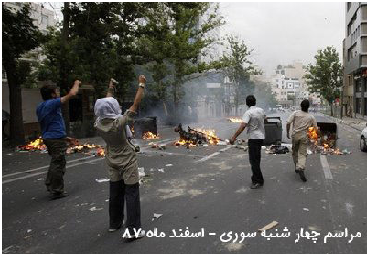
مراسم چهارشنبه سوری - اسفند ماه ۸۷