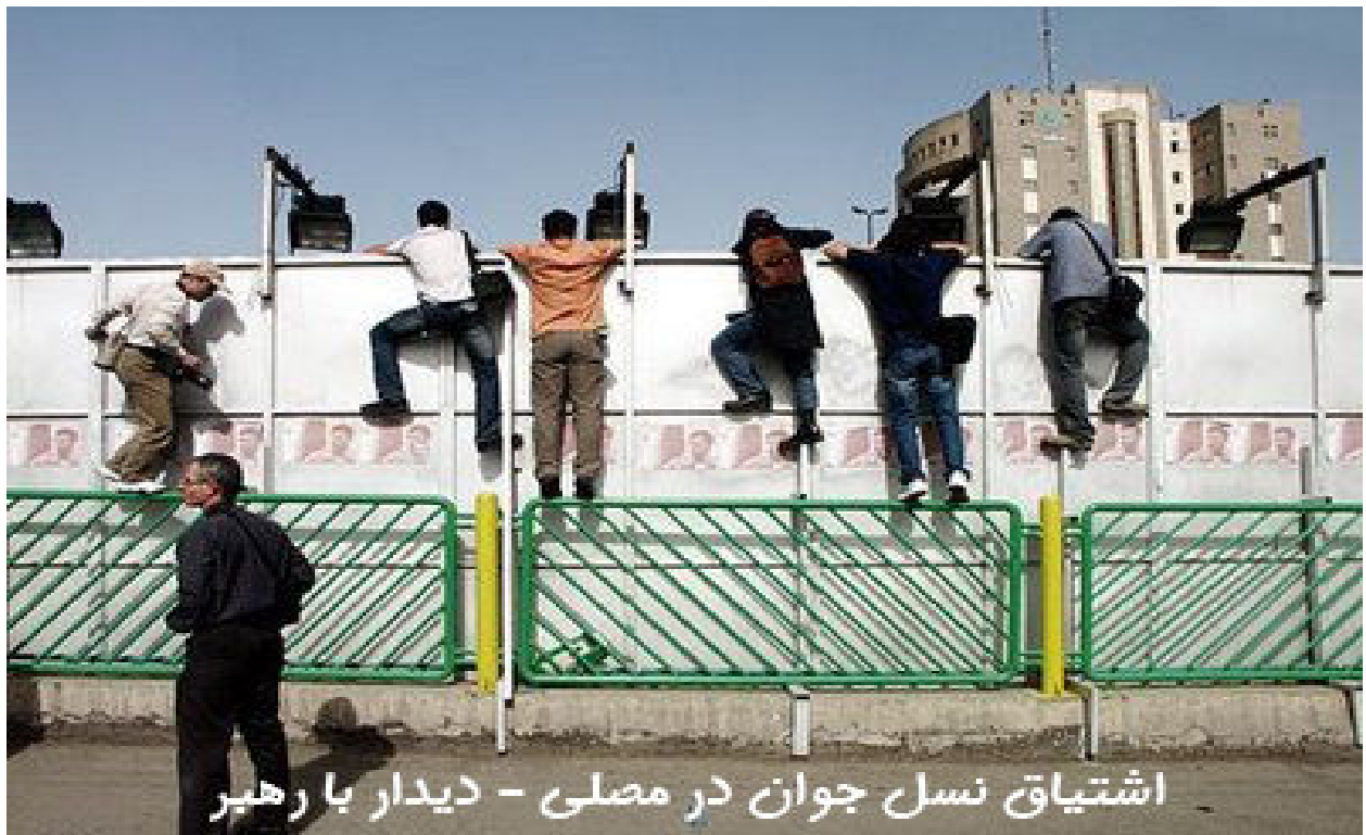
اشتیاق نسل جوان در مصلی - دیدار با رهبر