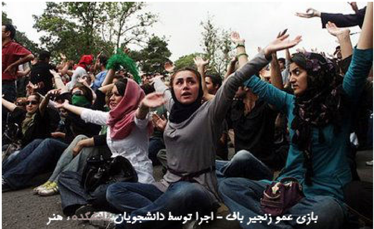
بازی عمو زنجیر پاک - اجرا توسط دانشجویان دانشگاه گدس، هنر