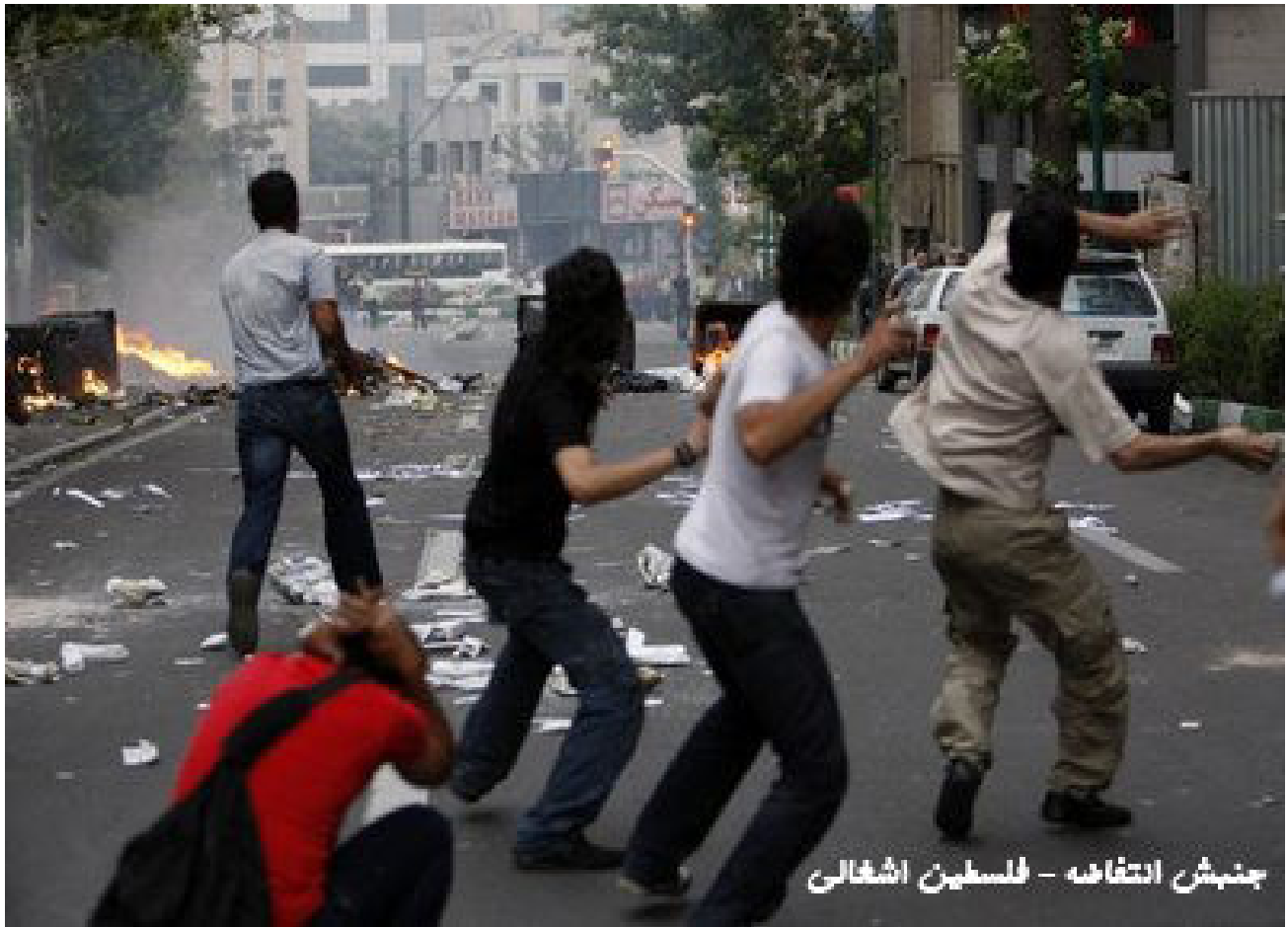
جنبش انتفاضه - فلسطین اشغالی