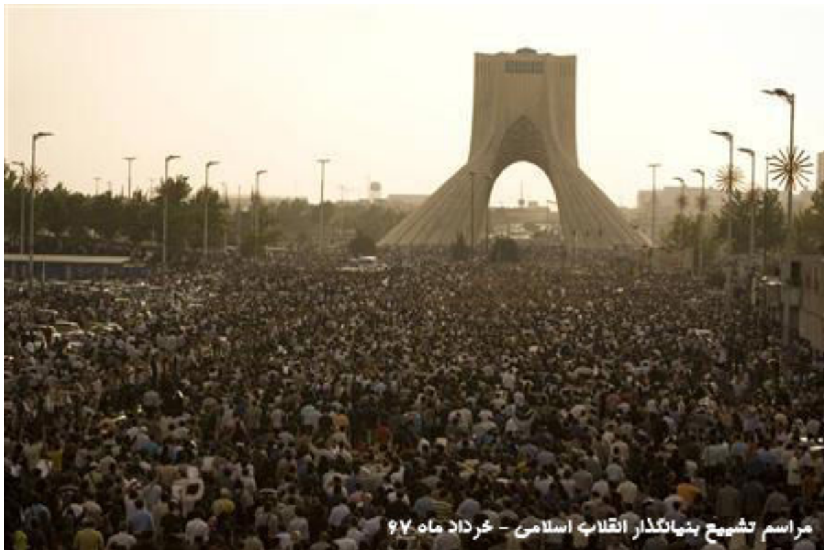
مراسم تشییع بنیانگذار انقلاب اسلامی - خرداد ماه ۹۷