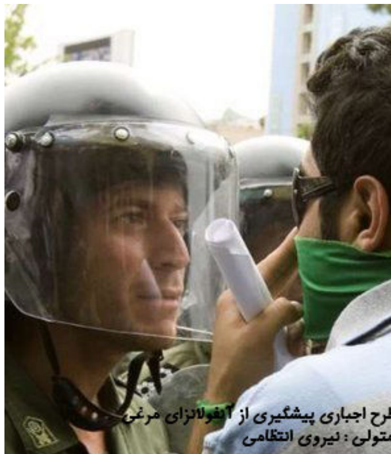
طرح اجباری پیشگیری از انفولانزای مرغی متولی: نیروی انتظامی