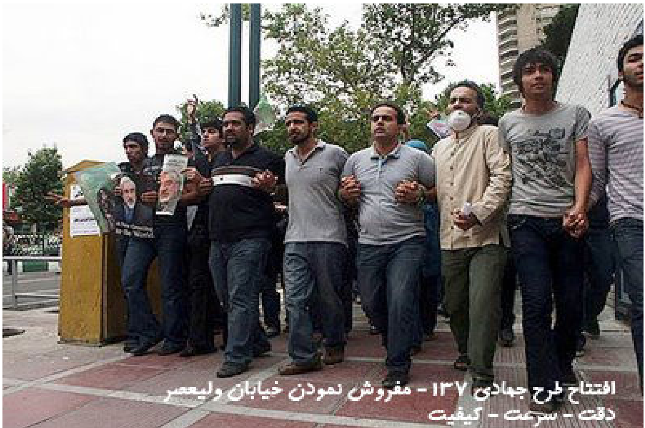
افتتاح طرح جهادی ۱۳۷ - مفروش نمودن خیابان ولیعمر دقت - سرعت - کیفیت